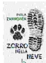
Per i ragazzi dagli 11 anni

Impegno Un bambino nel padiglione riservato al pubblico durante l'edizione 2015 della Fiera del Libro per Ragazzi