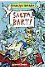
I libri per i bimbi dai 6 anni